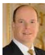
H.S.H. Prince Albert II of Monaco