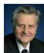
Jean-Claude Trichet President ECB

Message from OECD Secretary-General, Angel Gurría