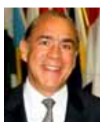
Angel Gurría Secretary-General OECD