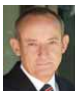
Yvo de Boer Executive Secretary UNFCCC