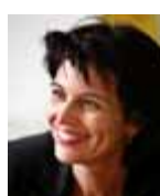
Doris Leuthard Federal Councillor Economic Affairs Switzerland